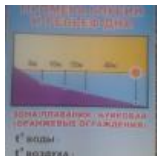
График промера глубин и рельеф дна