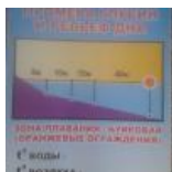
График промера глубин и рельеф дна